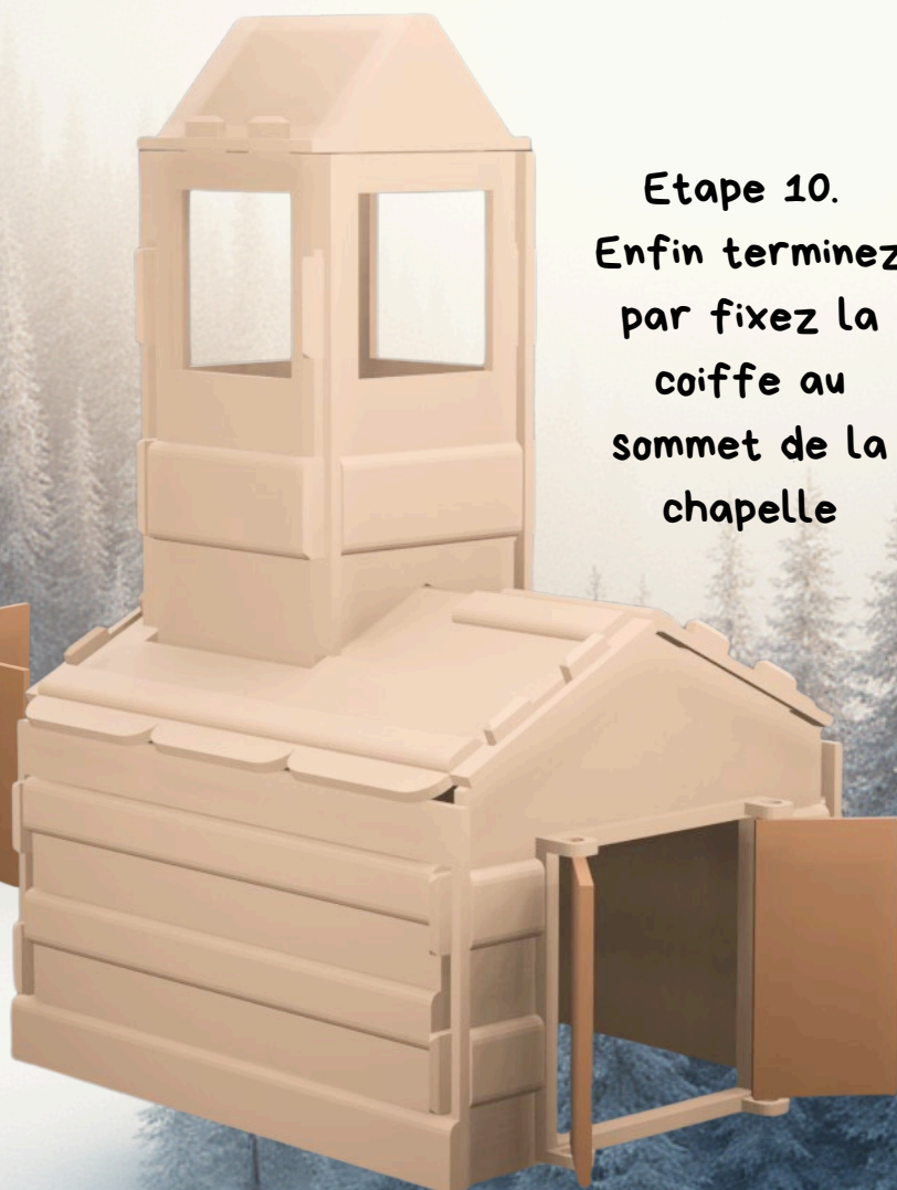
Etape 10. Enfin terminez par fixez la coiffe au sommet de la chapelle