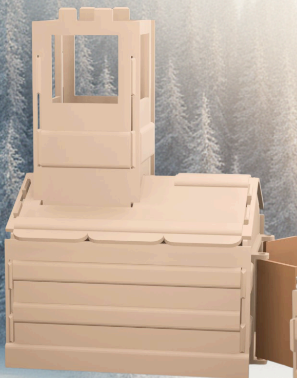
Etape 9. clipsez le dernier mur du clochet