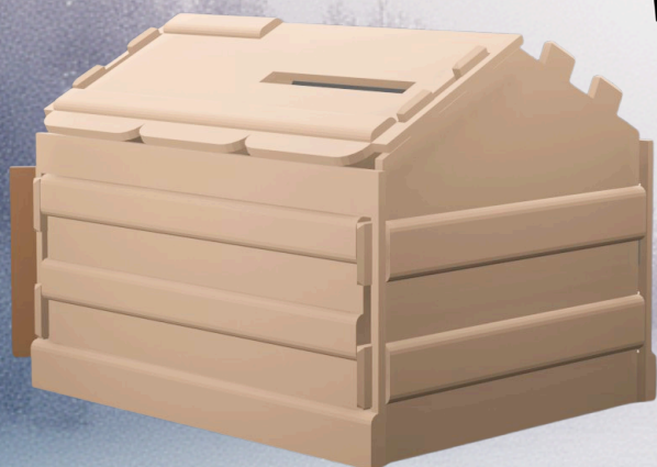
Etape 5. Clipsez le toit ( attention au sens )