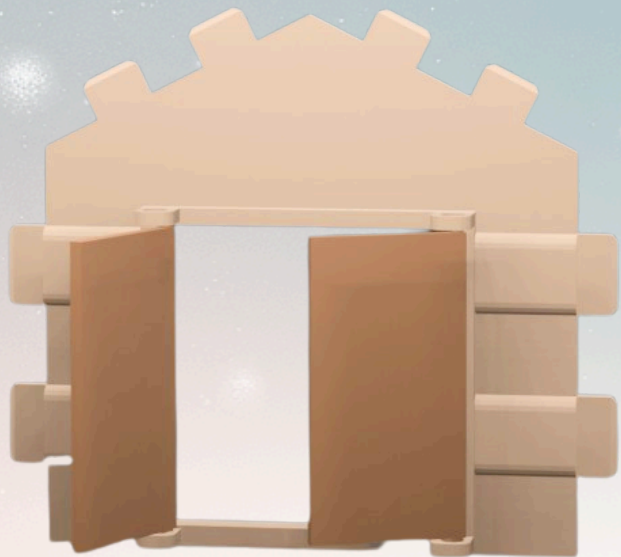
Etape 1. Clipsez les portes sur la face avant de la chapelle