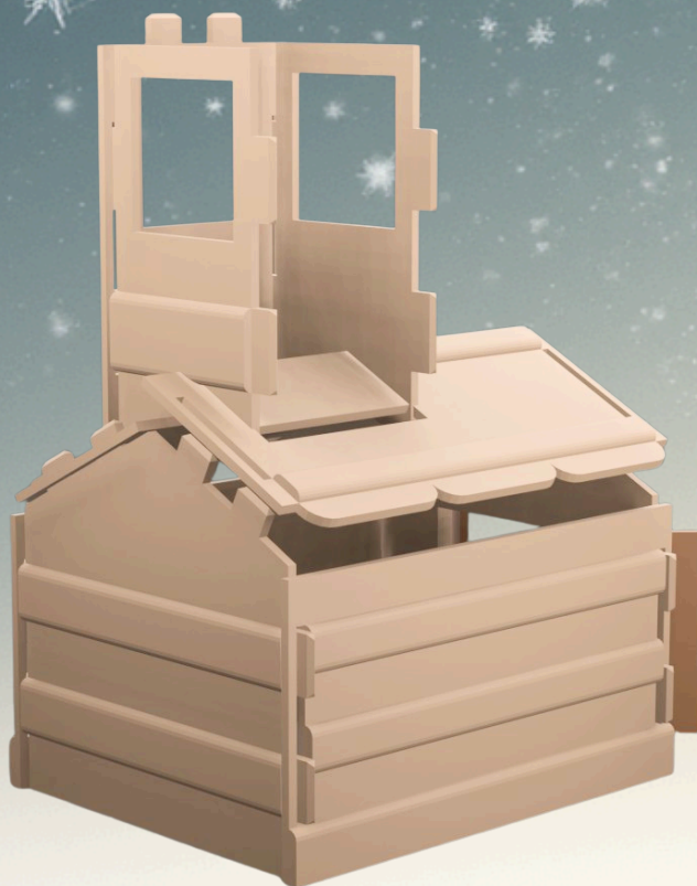
Etape 8. Assemblez l'autre coté du toit