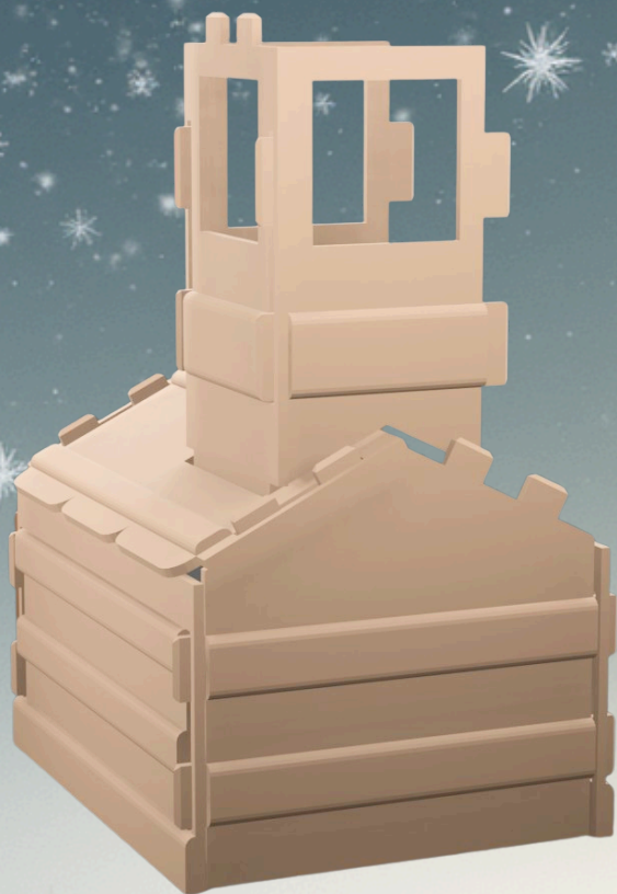
Etape 7. Clipsez les cotés du clochet