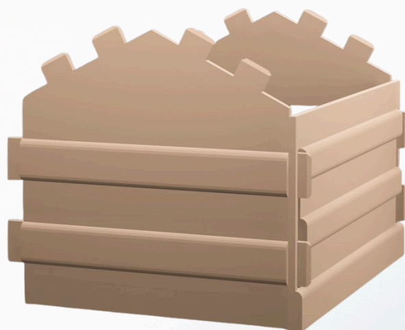
Etape 3. Puis l'arrière de celle ci