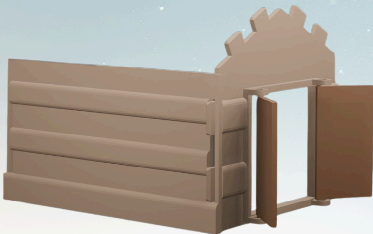
Etape 2. Assemblez le côté gauche de la chapelle