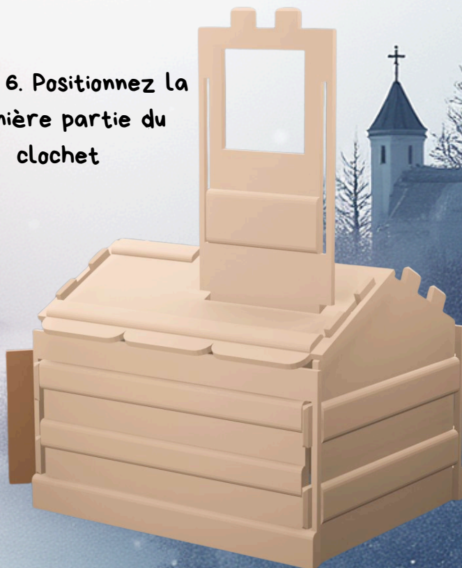
Etape 6. Positionnez la première partie du clochet